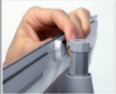
Panel einhängen, Teleskopstange auf die gewünschte Höhe ausfahren.