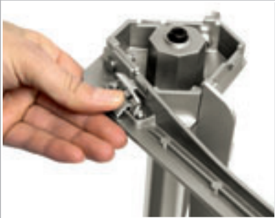
Standfest: Die drei Füße nur ausgeklappt arretiert werden.

von vier Panelbreiten sowie des variabel ausfahrbaren Teleskopstabs ergeben sich vielfältige Gestaltungsmöglichkeiten. Natürlich kann das Pole System beidseitig mit Grafikpanel bestückt werden. Als Zubehör ist der 50 Watt starke Halogenstrahler „Premium“ für das Pole System erhältlich.