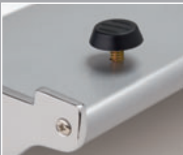
Verstellbare Füße gleichen Bodenunebenheiten aus

Die Lampentasche läßt sich praktisch mit der Roll Up-Transporttasche verbinden.