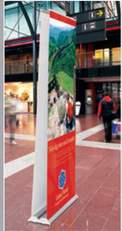
Auch als doppel-seitige Version erhältlich

Ein weiterer Clou ist die doppel-seitige Version des Roll Up Professional Systems: Zwei Grafiken pro System bekräftigen Sie in Ihrer Message, denn doppelt „wirkt“ besser!