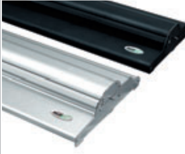
Farbe: silber oder schwarz