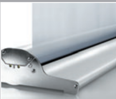
Formschön und standfest

Roll Up Classic – seit Jahren der beliebte Klassiker unter den Banner-Systemen. Der sekundenschnelle Auf- und Abbau und die einfache Handhabung machen das System zur Nummer Eins!