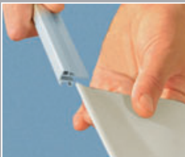
Die Einschubtechnik ermöglicht einen schnellen Grafikwechsel