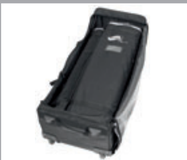
Eine gepolsterte Transporttasche gehört zum Lieferumfang