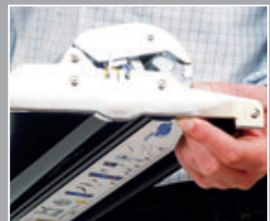
Ein Klick auf der Unterseite genügt und die Grafik kann ausgetauscht werden