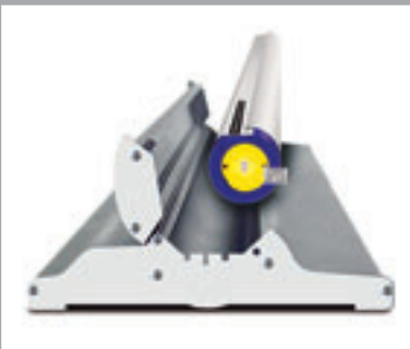
Die Grafik ist im Gehäuseinneren geschützt