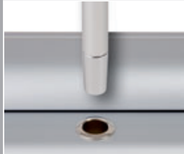
Roll Up Professional: Perfekter Sitz durch konische Edelstahl-Einsätze