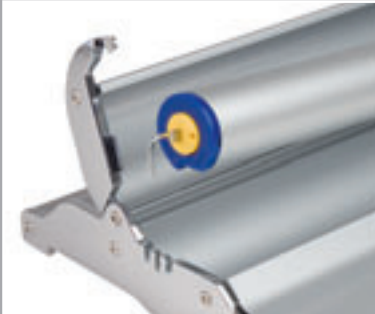
Roll Up Professional: Bannerwechsel mit wenigen Handgriffen