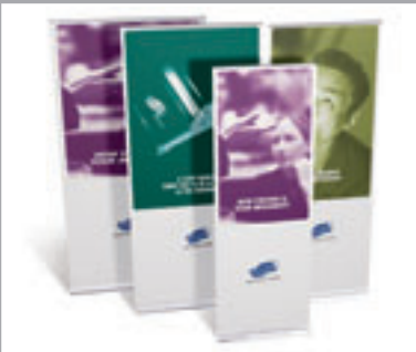
Zur Auswahl stehen vier Breiten