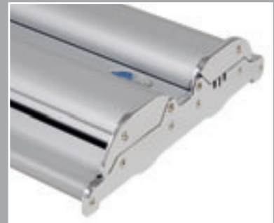
Das Roll Up Professional, hier in der doppel-seitigen Version, im edlen Silber